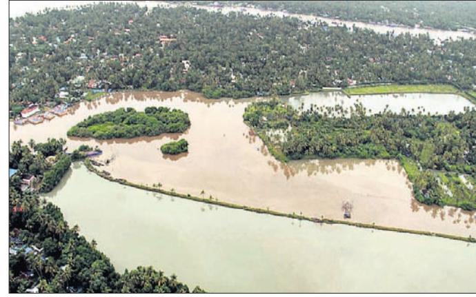
ଭାରତ ୭୯.୫ ବିଲିୟନ ଏବଂ ନିୟୁତ ଲୋକ ପ୍ରାଣ ହରାଇଥିବା ବେଳେ

ଜାତିସଂଘ: ବିଗତ ୨୦ବର୍ଷରେ ପ୍ରାକୃତିକ ବିପର୍ଯ୍ୟୟ ଯୋଗୁଁ ଭାରତର ୭୯.୫ ବିଲିୟନ ଆମେରିକୀୟ ଡଲାର କ୍ଷତି ହୋଇଥିବା ଜାତିସଂଘର ଏକ ରିପୋର୍ଟରୁ ସୂଚନା ମିଳିଛି। 'ଇକୋନୋମିକ୍ ଲଭ୍‌ସେଫ୍, ପର୍ଭର୍ ଆଣ୍ଡ ଡିକାଷ୍ଟର୍ଭ ୧୯୯୮-୨୦୧୭' ଶୀର୍ଷକ ରିପୋର୍ଟ ଜାତିସଂଘର ବିପର୍ଯ୍ୟୟ ପ୍ରଶ୍ନମ୍ ଚକ୍ରର ଦ୍ୱାରା ପ୍ରକାଶ ପାଇଛି। ଏଥିରେ କୁହାଯାଇଛି, ବିଶ୍ୱରେ ୧୯୯୮ରୁ ୨୦୧୭ ମଧ୍ୟରେ ପ୍ରାକୃତିକ ବିପର୍ଯ୍ୟୟ ଯୋଗୁଁ ପ୍ରତ୍ୟକ୍ଷ ଆର୍ଥିକ କ୍ଷତି ୧୫୧% ହୋଇଛି। ସେହିପରି ଗ୍ରହଣ କରାଯାଇଥିବା ପୂର୍ବତତ ରେଳପଥ ସୂଚନା ଦେଇଛି। ଟ୍ରାକ୍ ବିଶେଷତା, ବ୍ରିକ୍ ଇଞ୍ଜିନିୟର, ଓଭରହେଡ୍ ଇଲେକ୍ଟ୍ରିଫିକ୍ ଇଞ୍ଜିନିୟର ମାନେ ଛିଡ଼ି ଅନୁଧ୍ୟାନ କରିଛନ୍ତି। ବ୍ରହ୍ମପୁର-ପଲ୍ଲୀ ଏବଂ ପଲ୍ଲୀ-କୋଟାବୋମ୍ପାଳି ମଧ୍ୟରେ ସ୍ଥାନଗୁଡ଼ିକର ଛିଡ଼ିକୁ ବିଚାର କରାଯାଇଛି।