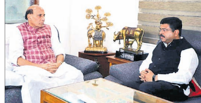
ସ୍ୱରାଷ୍ଟ୍ରମନ୍ତ୍ରୀ ରାଜନାଥ ସିଂଙ୍କ ସହ କେନ୍ଦ୍ର ପେଟ୍ରୋଲିୟମ୍ ମନ୍ତ୍ରୀ ଧର୍ମେନ୍ଦ୍ର ପ୍ରଧାନ ଆଲୋଚନା କରୁଛନ୍ତି।

ଗାଡ଼ି ଚଳାଚଳ ୦୯ ହୋଇଯାଇଛି। ସେହିପରି ରାୟଗଡ଼ା-ବ୍ରହ୍ମପୁର ୧୭ ନମ୍ବର ରାଜ୍ୟ ରାଜପଥରେ ଗଛ ପଡ଼ି ରାସ୍ତା ଅବରୋଧ ଯୋଗୁଁ ବସ୍ ଚଳାଚଳ ବନ୍ଦ ରହିଛି। ପ୍ରବଳ ବର୍ଷା ଯୋଗୁଁ ରାୟଗଡ଼ାର ଗୁମ୍ଫାପୁରଠାରେ ବଂଶଧାରୀ ବିପଦସଙ୍କେତ ଅତିକ୍ରମ କରିଛି।