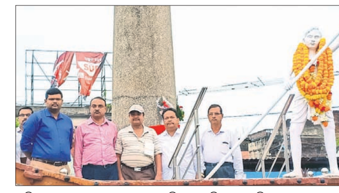
ବାଜି ରାଉତଙ୍କ ଶ୍ରାଦ୍ଧ ଅବସରରେ ଶହୀଦ ମିନାରରେ ଜିଲ୍ଲା ପ୍ରଶାସନିକ ଅଧିକାରୀମାନେ।