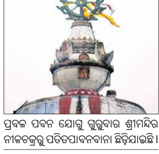
ପ୍ରବଳ ପବନ ଯୋଗୁଁ ଗୁରୁବାର ଶ୍ରୀମନ୍ଦିର ନାକଚକ୍ରକୁ ପତଟପାଦନକାରୀ ହିଡ଼ିଯାଇଛି।

ପାରଳାଖେମୁଣ୍ଡି, (ସ.ପ୍ର.)/ରାୟଗଡ଼ା ଅଫିସ ୧୧/୧୦