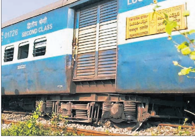
ଲାଇନରୁତ ହୋଇଥିବା ବରି।

ବାକକୁ ଜଣାଇଥିଲେ। ଫଳରେ ବର୍ଜିତ ଗାଁ ନିକଟରେ ଚାକ ଟ୍ରେନ୍ରୁ ଅଟକାଇଥିଲେ। ଏହା ଜାଣିବାପରେ ଯାତ୍ରୀମାନେ ଭୟଭୀତ ହୋଇ ଟ୍ରେନ୍ରୁ ଓହ୍ଲାଇ ପଡିଥିଲେ।