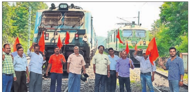
ଖାଦାନ ମଜଦୁର ସଂଘ ପକ୍ଷରୁ ରେଳରୋକୋ କରାଯାଇଛି ।