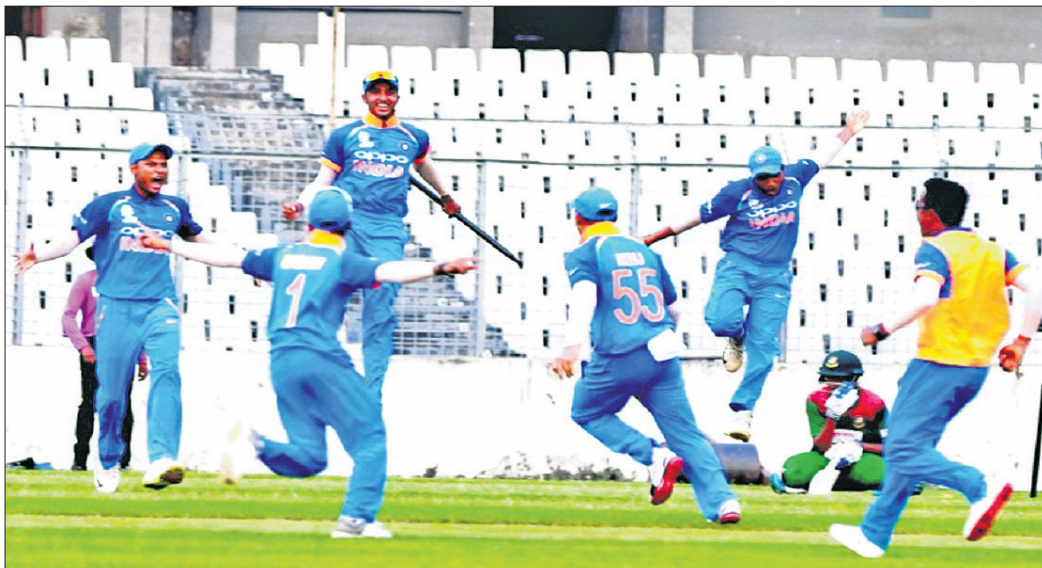
ବାଂଲାଦେଶକୁ ପରାସ୍ତ କରିବା ପରେ ଉତ୍ତର ଭାରତୀୟ ଦଳ ।