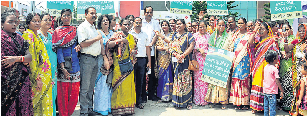
ମହିଳା ବିଜେଡି ପକ୍ଷରୁ ରୁରୁବାର ଚନ୍ଦ୍ରଶେଖରପୁର ଆଇଓସିଏଲ୍ ଅଧିକାରୀଙ୍କୁ ବିକ୍ଷୋଭ କରାଯାଇଛି।

ସରକାର ଆସିବା ପରଠାରୁ ରକ୍ଷନ ଗ୍ୟାସ୍ ମୂଲ୍ୟବୃଦ୍ଧି ହୋଇଛି। ୨୦୧୪ ମେ ମାସରେ ଗୋଟିଏ ଦିନରେ ୪୪୪ ଟଙ୍କାରେ ମିଳୁଥିଲା। ଏବେ ସୁଦ୍ଧା ଯୋଜନାରେ ଭୁବନେଶ୍ୱରରୁ ମହିଳା ବିଜେଡି ଆଇଓସିଏଲ୍ କାର୍ଯ୍ୟାଳୟ ସମ୍ମୁଖରେ ବିକ୍ଷୋଭ ପ୍ରଦର୍ଶନ କରିଛି।