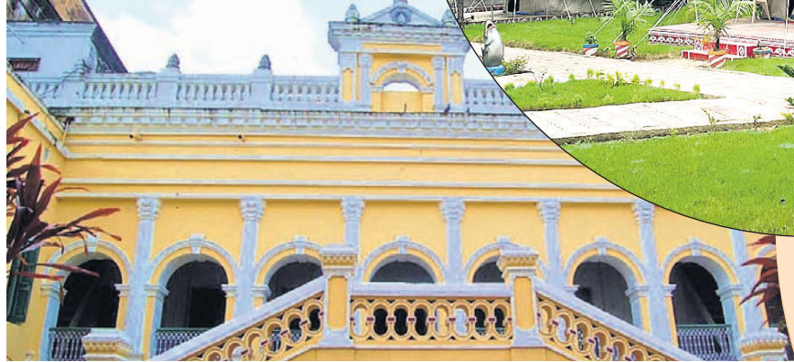
ପରିଶତ କରାଯାଇପାରିବ ତାହା ଉପରେ ଫୋକସ୍ ରହିଛି।

ରାଜ୍ୟରେ ଏକାଧିକ ବନ୍ୟପ୍ରାଣୀ ଅଭୟାରଣ୍ୟ ସହ ବିସ୍ତୃତ ଜଙ୍ଗଲ, ସୁଉଜ ପର୍ବତ, ନଦୀ, ଜଳପ୍ରପାତ, ଗଭୀରତମ ଗଣ୍ଡ ଭଳି ପ୍ରାକୃତିକ କ୍ଷେତ୍ର ଭରି ରହିଛି। ପରିବେଶ ପର୍ଯ୍ୟଟନ ବା ଇକୋ-ଟୁରିଜମ୍ ପାଇଁ ଏଠାରେ ପର୍ଯ୍ୟାପ୍ତ ସୁଯୋଗ ରହିଛି, ଯାହାକୁ ଦୃଷ୍ଟିରେ ରଖି ଆସନ୍ତା କିଛିବର୍ଷ ମଧ୍ୟରେ ଓଡ଼ିଶାକୁ ଦେଶର ଇକୋ-ଟୁରିଜମ୍ ହବ୍‌ରେ ପରିଣତ କରିବାକୁ ରାଜ୍ୟ ସରକାର ଲକ୍ଷ୍ୟ ରଖିଛନ୍ତି। ଏଥିପାଇଁ ରାଜ୍ୟ ସରକାରଙ୍କ ଦ୍ୱାରା ବିଭାଗ ପର୍ଯ୍ୟଟନ ଓ ଜଙ୍ଗଲ ବିଭାଗ ମଧ୍ୟରେ ଏକ ଗୁରୁତ୍ୱପୂର୍ଣ୍ଣ ଓଏମ୍‌ସି ସ୍ୱାକ୍ଷର ହୋଇଥିବାବେଳେ ଉଭୟ ବିଭାଗ ଏବେ ମିଳିତଭାବେ କାର୍ଯ୍ୟ କରୁଛନ୍ତି। ପରିବେଶ ପର୍ଯ୍ୟଟନସ୍ଥଳୀ ପ୍ରତି ପର୍ଯ୍ୟଟକଙ୍କୁ ଆକୃଷ୍ଟ କରିବା ପାଇଁ ଉଚ୍ଚ ସ୍ତରରେ ରହିଣି ବ୍ୟବସ୍ଥା ସହ ପାରିପାର୍ଶ୍ୱିକ ସୁବିଧା ସୁଯୋଗ ପ୍ରଦାନ କରାଯାଇଛି। ଏହିକ୍ରମରେ ରାଜ୍ୟର ୩୬ ପରିବେଶ ପର୍ଯ୍ୟଟନସ୍ଥଳୀରେ ଜଙ୍ଗଲ ବିଭାଗ ପକ୍ଷରୁ ନେତର କ୍ୟାମ୍ପ ପ୍ରତିଷ୍ଠା କରାଯାଇଛି। ଭିତରକନିକା, ଶିମିଳିପାଳ, ଚିଲିକା, ପୁରୀ ନୂଆନଳ, ଦାରିଙ୍ଗବାଡ଼ି, ଓକାଶୁଣୀ, ସିଧାମୂଳା, ରିସିଆ, ସାତକୋଶିଆ, ହୀରାକୁଦ, ସାନଘାଗରା, ଫୁଲବାଣୀ, ବେଲଘର, ଚନ୍ଦକା, ଅଂଶୁପା, ସପ୍ତଶଯ୍ୟା, ମହାବିନାୟକ ଭଳି ସ୍ଥାନରେ ପର୍ଯ୍ୟଟକଙ୍କ ରାତିରହଣି ପାଇଁ ନେତର କ୍ୟାମ୍ପ ବ୍ୟବସ୍ଥା କରାଯାଇଛି। ଆଉ ୯ଟି ସ୍ଥାନରେ ନେତର କ୍ୟାମ୍ପ ପ୍ରତିଷ୍ଠା ପାଇଁ ବିଭାଗ ଯୋଜନା ରଖିଥିବା ଜଙ୍ଗଲ ବିଭାଗ ପକ୍ଷରୁ କୁହାଯାଇଛି। ରାଜ୍ୟରେ ଥିବା ବିଭିନ୍ନ ପରିବେଶ ପର୍ଯ୍ୟଟନସ୍ଥଳୀରେ ଇତିମଧ୍ୟରେ ୨୩ ହଜାରରୁ ଅଧିକ ପର୍ଯ୍ୟଟକ ରହିସାରିଥିବା ବେଳେ 'ଇକୋଟୁର ଓଡ଼ିଶା' ଡ୍ରେଫ୍ଟାୟାର୍ ମାଧ୍ୟମରେ ହେଉଥିବା ଅନୁଲୋଚନ ବୁକିଂ ଦେଶ ବିଦେଶର ପର୍ଯ୍ୟଟକଙ୍କୁ ବିଶେଷଭାବେ ସହାୟ ହେଉଛି। କ୍ୟାମ୍ପିଂ, ଟ୍ରେକିଂ, ବାର୍ଡିଂ, ବୋଟିଂ, ଇକୋ-ରିସର୍ଚ ଭଳି ଅତ୍ୟାଧୁନିକ ସୁବିଧା ପର୍ଯ୍ୟଟକଙ୍କୁ ଓଡ଼ିଶାର ପରିବେଶ ପର୍ଯ୍ୟଟନସ୍ଥଳୀ ପ୍ରତି ଆକୃଷ୍ଟ କରୁଛି।