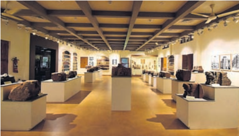
- ରିପୋର୍ଟ: ସମ୍ପତ୍ତା ପାଇକରାୟ

ରାଜ୍ୟରେ ସଂଗ୍ରହାଳୟ ପର୍ଯ୍ୟଟନର ବିକାଶ କରିବାକୁ ସରକାର ଯୋଜନା ପ୍ରସ୍ତୁତ କରିଛନ୍ତି। ଏଥିପାଇଁ ଭୁବନେଶ୍ୱରରେ ଥିବା ରାଜ୍ୟ ସଂଗ୍ରହାଳୟ, ଆଦିବାସୀ ସଂଗ୍ରହାଳୟ, ଆଞ୍ଚଳିକ ପ୍ରାକୃତିକ ବିଜ୍ଞାନ ସଂଗ୍ରହାଳୟ, ହସ୍ତଶିଳ୍ପ ଓ ହସ୍ତକଳା ସଂଗ୍ରହାଳୟ, ରିଜିଓନାଲ ସାଇନ୍ସ ସେଣ୍ଟର, ରିଜିଓନାଲ ପ୍ଲାଷ୍ଟ ରିସୋର୍ସ ସେଣ୍ଟର, ପଠାଣି ସାମନ୍ତ ପ୍ଲାନେଟାରିୟମ୍ ପରି ୧୨ଟି ସଂଗ୍ରହାଳୟ ସହ ଆଲୋଚନା କରାଯାଇଛି। ସେହିଭଳି ଓଡ଼ିଶା ରାଜ୍ୟ ହସ୍ତଶିଳ୍ପ ଓ ହସ୍ତକଳା ସଂଗ୍ରହାଳୟ 'କଳାଭୂମି' ପ୍ରତି ପର୍ଯ୍ୟଟକଙ୍କୁ ଆକୃଷ୍ଟ କରିବାକୁ ସଂଗ୍ରହାଳୟ ପଦସାଦ୍ରା ବା ମ୍ୟୁଜିୟମ୍ ଓ୍ଵାକ୍ ଆରମ୍ଭ ହୋଇଛି।