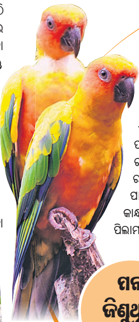
ପାନ ଜିଣୁଥିବା ସ୍ଥାନ

ପକ୍ଷୀ ଦେଖିବା ପାଇଁ ନନ୍ଦନକାନନ ଜୈବ ଉଦ୍ୟାନରେ ୩ ସ୍ଥାନ ରହିଛି। ସେଥିମଧ୍ୟରୁ 'ପାଦଚଲା ବିହଙ୍ଗ ସରଣୀ'(ଝାକ୍-ଥ୍ରେ ଆଭିଏରି)କୁ ପର୍ଯ୍ୟଟକ ଅଧିକ ପସନ୍ଦ କରନ୍ତି। ୨୦୧୪ ଡିସେମ୍ବର ୨୯ରେ ଉଦ୍‌ଘାଟିତ ହୋଇଥିବା ଏହି ସରଣୀ ନିମନ୍ତେ ୯୦ ଲକ୍ଷ ଟଙ୍କା ଖର୍ଚ୍ଚ ହୋଇଥିଲା। ଏହା ଏପରି ଜଙ୍ଗଲରେ ତିଆରି ହୋଇଛି, ଯେଉଁଠି ପକ୍ଷୀମାନଙ୍କ ଗହଣରେ ରହି ପର୍ଯ୍ୟଟକ ମନଲୋଭା ପ୍ରାକୃତିକ ପରିବେଶର ମଜା ଉଠାଇପାରିବେ। ଏହା ମଧ୍ୟରେ ରହିଛି ୨୦ଟି ପକ୍ଷୀବସା ସାଙ୍ଗକୁ କୃତ୍ରିମ ଝରଣା। ପକ୍ଷୀମାନଙ୍କ ବସବାସ ପାଇଁ ଅନେକ ଗଛ ରହିଛି। ବର୍ତ୍ତମାନ ଅନୁ୍ୟ ୧୫ ପ୍ରଜାତିର ପ୍ରାୟ ୧୫୦ ପକ୍ଷୀ ଖୋଲାରେ ରହିଛନ୍ତି। ଏମାନଙ୍କ ପାଇଁ କୌଣସି ପିଞ୍ଜରା ହୋଇନାହିଁ। ପର୍ଯ୍ୟଟକମାନେ ସେଠାକୁ ଗଲେ ପକ୍ଷୀମାନେ ସେମାନଙ୍କ କାନ୍ଧ, ମୁଣ୍ଡରେ ମଧ୍ୟ ବସିଯାଆନ୍ତି, ଯାହା ପର୍ଯ୍ୟଟକଙ୍କୁ ଖୁବ୍ ଆନନ୍ଦ ଦେଇଥାଏ। ବିଶେଷକରି ପିଲାମାନଙ୍କ ପାଇଁ ମାଟି ଉପରେ ବସିପାରୁଥିବା ଏବଂ ଅଳ୍ପ ଉଚ୍ଚରେ ଉଡୁଥିବା ପକ୍ଷୀ ଅଧିକ ଆକର୍ଷଣୀୟ ସାଜୁଛନ୍ତି। ତେବେ ଏଠାରେ ଥିବା ସନ୍ କନ୍ୟାରୁ, ସିଲଭର୍ ଫି କାଣ୍ଡ , ପକ୍ଷୀ ଗୋଲଡେନ୍ ଫିଜାଣ୍ଡ ପ୍ରଜାତିର ଦର୍ଶକଙ୍କୁ ଅଧିକ ଭଲଲାଗେ।