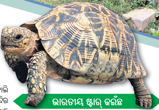
ଭାରତୀୟ ସ୍ତୂର କଳ୍ପ

ବୋଲି ବିଶ୍ୱାସ ରହିଛି। ଗଞ୍ଜାମ ଜିଲ୍ଲାର ସାଧବ ପୁତ୍ରମାନେ ନୌବାଣିଜ୍ୟ କରିବା ପାଇଁ ଯାଉଥିବା ବେଳେ ମା'ଭୈରବୀଙ୍କୁ ପୂଜାର୍ଚ୍ଚନା କରି ପ୍ରାକୃତିକ ଦୁର୍ବିପାକରୁ ମୁକ୍ତି ପାଇବା ପାଇଁ ଆଶିଷ ଭିକ୍ଷା କରୁଥିଲେ ବୋଲି କିମ୍ବଦନ୍ତୀରୁ ଜଣାପଡ଼ିଛି। ମନ୍ଦିର ନିକଟରେ ଜଗନ୍ନାଥ ମନ୍ଦିର ଏବଂ ୧୦୮ ମନ୍ଦିର ପ୍ରତିଷ୍ଠା ହୋଇଛି। ଏହି ପୀଠରେ ଅନ୍ୟ ଦିନମାନଙ୍କ ଅପେକ୍ଷା ଦଶହରାରେ ନବରାତ୍ର ପୂଜା ହୋଇଥାଏ। ମା'ଙ୍କ ଘଟକୁ ହରତଳା ଗ୍ରାମ ପରିକ୍ରମା କରାଯାଇଥାଏ। ଭକ୍ତ ମାନଙ୍କ ପାଇଁ ଅନ୍ନ ପ୍ରସାଦ, ଖେରୁଡ଼ି ଭୋଗ, ପୁଲିଆରା ଓ ଲତୁ ଭୋଗ ଆଦି ଭୋଗ ମିଳିଥାଏ। ପ୍ରତିଦିନ ଶ୍ରଦ୍ଧାଳୁ ମାନଙ୍କ ପ୍ରସାଦ ପରିବେଷଣ ପାଇଁ ମନ୍ଦିର ପରିଚାଳନା କମିଟି ନିୟନ୍ତ୍ରିତ କରୁଛନ୍ତି। ଆଖପାଖର ୭୦ ଖଣ୍ଡ ଗ୍ରାମକୁ ନେଇ ମନ୍ଦିର ପରିଚାଳନା କମିଟି ଗଠିତ ହୋଇଛି। ଦେବୀ ପୀଠରେ ତିନୋଟି ଭାରତୀୟ ସ୍ତୂର କଳ୍ପ ରହିଛି, ଯାହା ପର୍ଯ୍ୟଟକମାନଙ୍କୁ ଆକୃଷ୍ଟ କରିଛି।