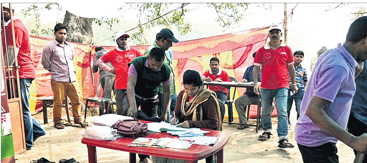
ଅନୁଷ୍ଠାନ ପକ୍ଷରୁ ଆୟୋଜିତ ରକ୍ତଦାନ ଶିବିରରେ ଜଣେ ସଦସ୍ୟ ରକ୍ତଦାତାଙ୍କ ନାମ ପଞ୍ଜୀକରଣ କରୁଛନ୍ତି।

ବ୍ରଗୋଷ୍ଠୀ ସଚେତନ ହେଲେ ସାମାଜିକ ସ୍ଥିତିରେ ଆସିପାରିବ ସୁଧାର। ଏଭଳି ବିଶ୍ୱାସ ରଖି 'ବ୍ୟାସକବି ସାଂସ୍କୃତିକ ଅନୁଷ୍ଠାନ' ଯୁବପିଢ଼ିକୁ ସେବାମୂଳକ କାର୍ଯ୍ୟ କରିବାକୁ ଉତ୍ସାହିତ କରିବା ଦିଗରେ ସବୁବେଳେ କାର୍ଯ୍ୟ କରିଚାଲିଛି। ସଙ୍ଗଠନର ଯୁବକମାନେ ଦରକାର ବେଳେ ଅସହାୟଙ୍କୁ ସହାୟତାର ହାତ ବଢାଇ ଚର୍ଚ୍ଚାକୁ ଆସିଛନ୍ତି। ବିଭିନ୍ନ ସମୟରେ ସାଂସ୍କୃତିକ କାର୍ଯ୍ୟକ୍ରମ ଆୟୋଜନ କରି ସଚେତନତାର ବାର୍ତ୍ତା ବାଣ୍ଟି ଆସୁଛନ୍ତି। ୧୯୯୪ ମସିହାରେ ବାଲେଶ୍ୱର ଜିଲା ସଦର ବ୍ଲକ୍ ହଳଦୀପଦା ଅଞ୍ଚଳର ଶିକ୍ଷିତ ଯୁବଗୋଷ୍ଠୀ ଏକତ୍ରିତ ହୋଇ ଏହି ଅନୁଷ୍ଠାନ ଗଢ଼ି ଆଗକୁ ବଢି ଚାଲିଛନ୍ତି। ସେମାନଙ୍କ କାର୍ଯ୍ୟ ଓ ମନୋବଳ ଅନ୍ୟମାନଙ୍କୁ ଯୋଗାଇଛି ପ୍ରେରଣା। ୧୯୯୮ ମସିହାର ଘଟଣା। ସ୍ଥାନୀୟ କୁରାଡ଼ିଆ ପଞ୍ଚାୟତର ଜଣେ ମହିଳା ତାଙ୍କ ସ୍ୱାମୀ ଓ ପିଲାଛୁଆଙ୍କ ସହ ହଳଦୀପଦା ବସ୍ତୁଶ୍ୱତ୍ୱରେ ବସକୁ ଅପେକ୍ଷା କରିଥିଲେ। ହଠାତ୍ ଏକ ବିଷଧର ସାପ ମହିଳାଙ୍କୁ କାମୁଡ଼ିଥିଲା। ସଂଗଠନର କର୍ମକର୍ତ୍ତାମାନେ ନିଜେ ଅର୍ଥ ସଂଗ୍ରହ କରି ଏହି ଅସହାୟ ମହିଳାଙ୍କୁ ବାଲେଶ୍ୱର ମେଡ଼ିକାଲ ନେଇ ଚିକିତ୍ସା କରାଇଥିଲେ। ପରେ ସୁସ୍ଥ ହୋଇ ସେ ଘରକୁ ଫେରିଥିଲେ। ବିଗତ ବର୍ଷରେ ଏଭଳି ଅନେକ ସେବାମୂଳକ କାର୍ଯ୍ୟର ନଜିର ଏହି ସଙ୍ଗଠନ ସୃଷ୍ଟି କରିଛି। ଏହାବାଦ୍ ଅନୁଷ୍ଠାନର କର୍ମକର୍ତ୍ତାମାନେ ସାଂସ୍କୃତିକ ଚେତନା ସୃଷ୍ଟି ଲାଗି ପ୍ରତିବର୍ଷ ବ୍ୟାସକବି ଫକୀରମୋହନଙ୍କ ଜୟନ୍ତୀ, ଝୁଲଣ ଯାତ୍ରା, ଜନ୍ମାଷ୍ଟମୀ, ହୋଲିପର୍ବ, ମକର ମିଳନ,