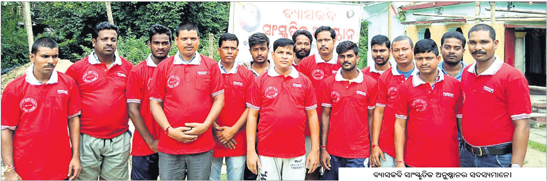
ବ୍ୟାସକବି ସାଂସ୍କୃତିକ ଅନୁଷ୍ଠାନର ସଦସ୍ୟମାନେ।